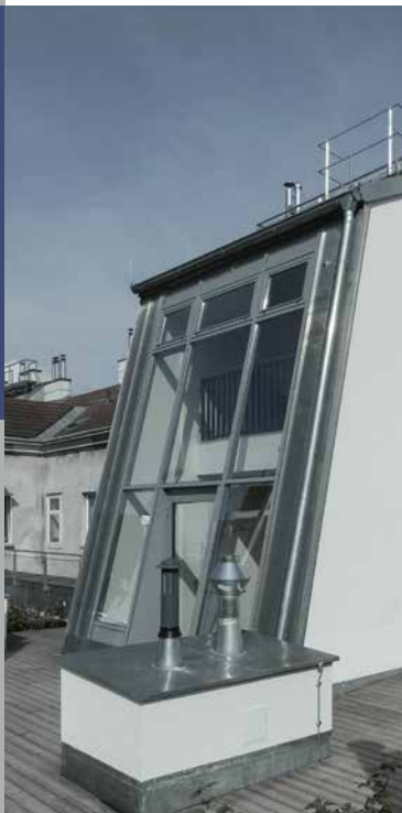
Portal- & Fassadenbau