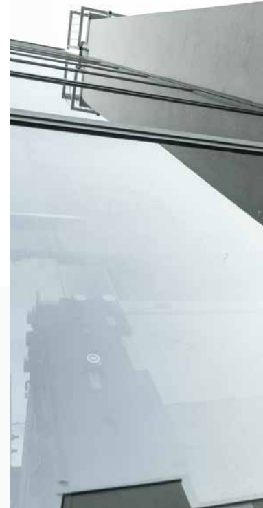
Aufzugsumwehungen & -portale

Mo-Do: 8 00 - 12 00 und 13 30 - 16 00 Fr: 8 00 - 12 00