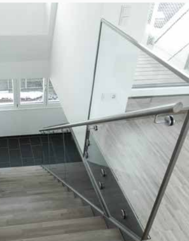
Glas Geländer & Metall-Treppen